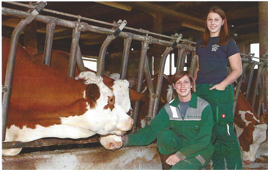
Družina Apovnik , kmetija pri Zdovcu (Senčni kraj)